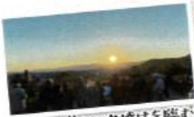
山頂から美しい夕焼けを臨む!

船岡山中で撮影した写真に「#京都ホームズ船岡山」と付けてInstagramに投稿し、コンテストに参加しよう! 投稿された写真の中から入選作品に選ばれば、望月麻衣先生とのリモート「ティーパーティー」にご招待! また、「望月麻衣賞(3名)」「北区長賞(1名)」に選ばれた方には、さらに素敵なプレゼントも!